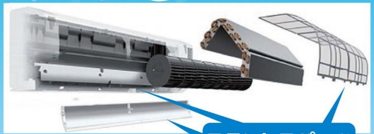
ステンレスパーツ